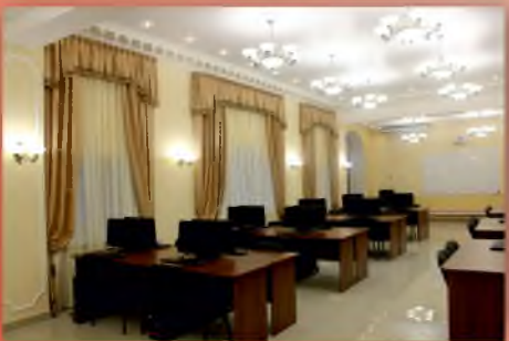
Аудитория расчетов пожарных рисков