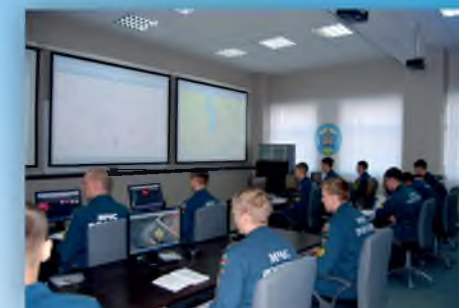
Занятия в Ситуационном центре института