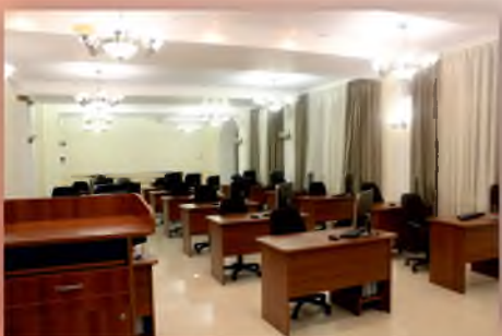
Кабинет дипломного проектирования