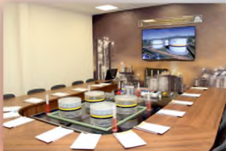
Интерактивный программно-аппаратный полигон